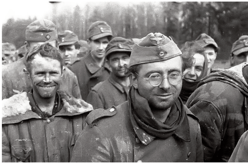
Koningsberg - 1945 - întoarcerea acasă