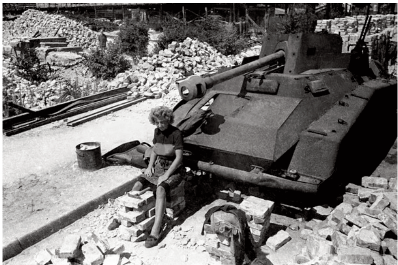
Berlin: Populația germană sub ocupația sovietică, 1945- 1946.