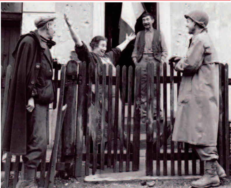
Belfort, France, 1944