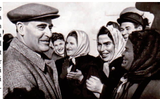
Gh. Gheorghiu Dej

În curtea lui Dumitru Tătăărăscu, gospodar de frunte al cărui