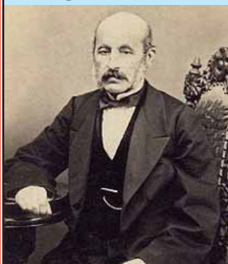
Petrache POENARU N. 10 ianuarie 1799