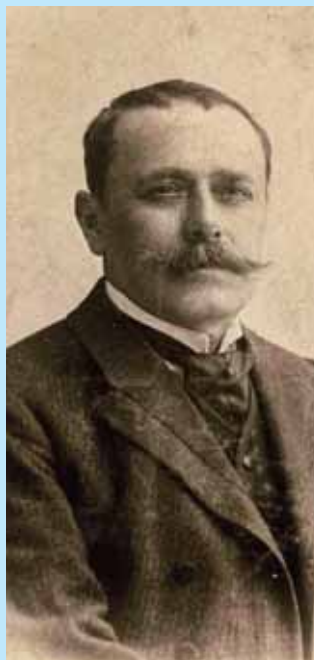
I.L. CARAGIALE N. 1/13 februarie 1852

Nicolae Ceaușescu va fi reabilitat în curând, pentru că este nevoie de eroi de care să ne folosim în bătălia pentru națiunea și limba română. A avut rolul lui negativ, dar dintotdeauna extragem ce folosește țării, nu ce a dăunat. Așa că în cel mult 10 ani „dictatorul” va intra în rândul eroilor români (prin comparație, câte capete a scurtat el, Ștefan cel Mare... cât a domnit... și iată-l sfânt în calendar). Nu cred că și Leana, care nu se va putea compara niciodată cu Regina Maria.