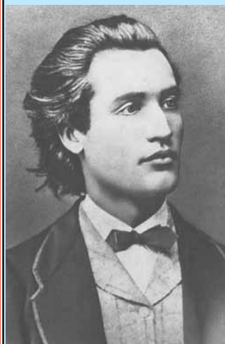
Mihai EMINESCU N. 15 ianuarie 1850

Ne gândim prea arar la câștigurile spirituale, la marile invenții (pe care le uităm imediat ce-am auzit de ele), și neglijăm pe ai noștri care i-au luminat și îmbogățit pe ai noștri ca prăpădiții lumii cu câte un giuvaer la butonieră. Să nu spuneți că vreunul invocă marea realizare a lui P. Poenaru , inventatorul stiloului care a pătruns în toată lumea și de unde s-au înmulțit invențiile cele mai diferite. Să ne facem sărbătoare de ziua vreunui Vasile care se sărbătorește în prima zi a anului, pare ușor și mai ales tare folositor.