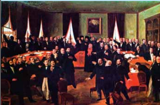
Theodor Amman – Proclamarea Unirii (1861)

Ioan Slavici e născut și el în ianuarie, dar... Mica Unire este faptul social-politic determinant pentru secolul trecut deci e o mare sărbătoare, dar nu e o personalitate.