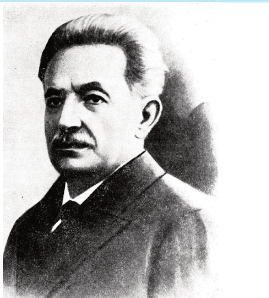
Ioan SLAVICI N. 18 ianuarie 1848

Dar, pentru că nimeni nu a trăit pe vremea poetului, tot nimeni nu poate depune mărturie și nimeni nu poate avea decât oarecari păreri sau presupuneri (se încadrează în sistemul de manipulare al timpului). Poezia și întreaga sa creație sunt cele care-l construiesc pe poet în eternitate.