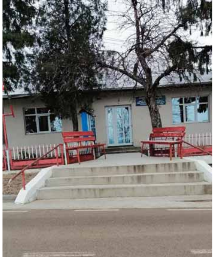
Primăria comunei BUNEȘTI-AVEREȘTI

După o perioadă mai lungă de timp am ajuns și în această localitate împrejurul căreia sunt amplasate cele mai organizate plantații de vie, și, evident singurul loc din județ unde se mai produce vin de calitate, de cea mai bună calitate.