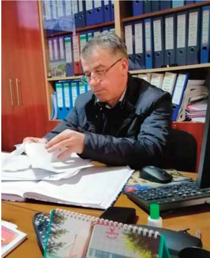
Vasile TĂRĂGAN primarul comunei BUNEȘTI-AVEREȘTI