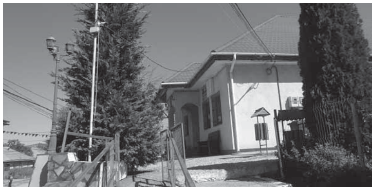
Primăria comunei IANA

Știind eu cam cum stau lucrurile pe aici, mă mulțumesc doar cu o informație suplimentară legată de noul Cămin, care pare gata, drept care l-am și filmat.