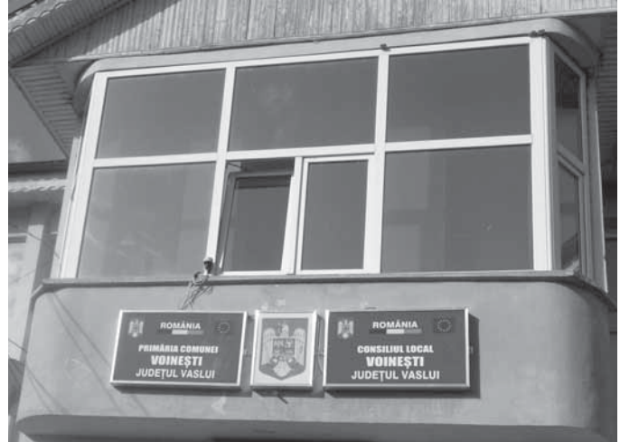
Primăria comunei VOINEȘTI, jud. VASLUI

Familia Gălcă s-a împrăștiat în lume, generațiile s-au schimbat. În comună s-au construit multe case noi și impunătoare, satul Gârdești arată ca o stațiune ascunsă după dealuri, iar la Voinești pe un kilometru sunt 5 case în construcție.