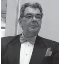
Transilvania, la 1 Decembrie 1918.

Mihai Eminescu în ziarul Timpul (1 martie 1878)