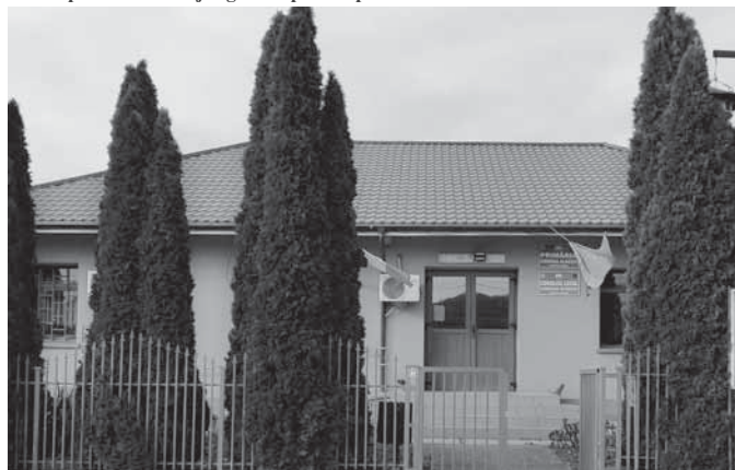
Primăria comunei ALBEȘTI

P: Avem în jur de 24 de kilometri în toată comuna pe care avem asfalt. Și mai avem vreo 34 km, nu știu exact acum, pe care îi avem pietruiti. Foarte puține ulițe au rămas pe care să nu ajungem să punem piatră.