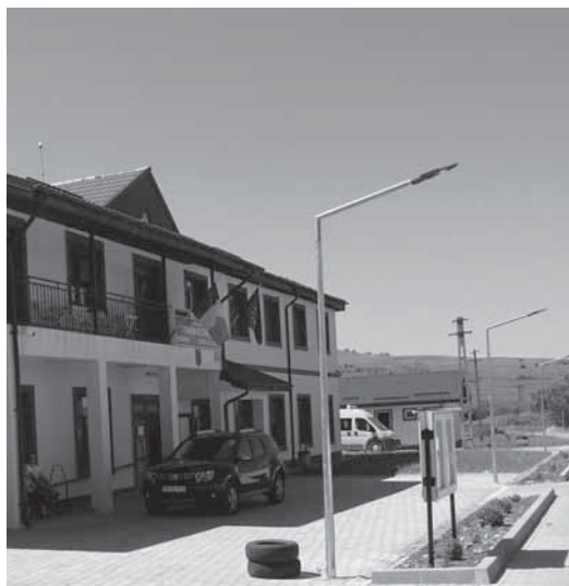
Primăria comunei OLTENEȘTI

s-a dat startul în ceea ce privește infrastructura pentru că am început în anul 2020 cu asfaltarea unui kilometru și anul acesta am continuat cu asfaltarea a aproximativ 3,5 km înșirat în cele trei componente ale comunei: Târzii, Oltenești și Curteni. Fiecare din cele trei sate a beneficiat de două-trei străzi asfaltate.