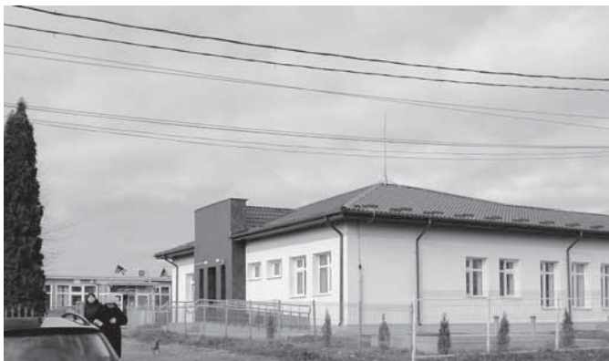
Noul dispensar de la ALBEȘTI

P: Da. Cadastrare pentru intravilan care este diferit de ce este cadastrul general.